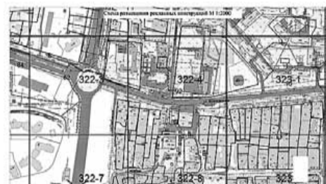
Условные обозначения: - отдельно стоящая щитовая установка, состоящая из заглубляемого фундамента, каркаса