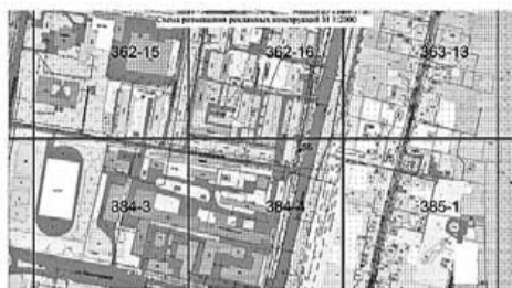
Условные обозначения: - отдельно стоящая щитовая установка, состоящая из заглубляемого фундамента, каркаса