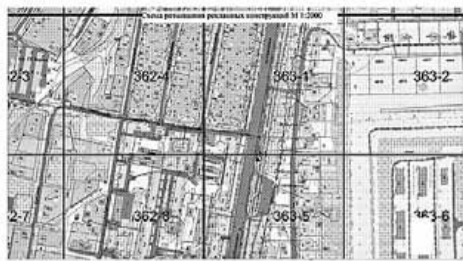
Условные обозначения: - отдельно стоящая щитовая установка, состоящая из заглубляемого фундамента, каркаса

Приложение к постановлению Администрации городского округа Саранск от 27 мая 2020 г. № 772