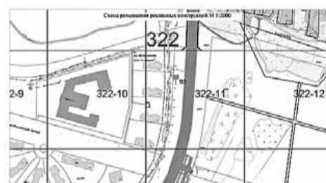
Условные обозначения: - отдельно стоящая щитовая установка, состоящая из заглубляемого фундамента, каркаса